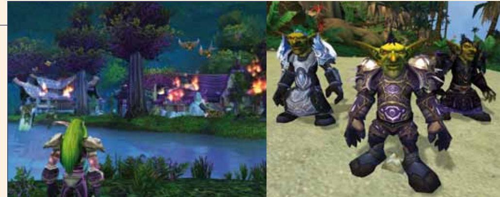
Bilder aus dem Rollenspiel „World of Warcraft“, das über zwölf Millionen SpielerInnen weltweit online spielen.